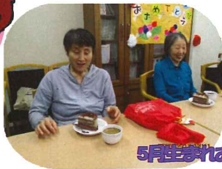
5月生まれ誕生日会